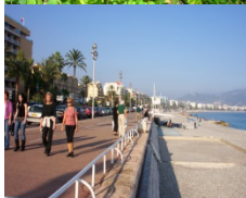
le printemps est de retour