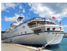
Le MS BERLIN Qui nous emmène en Andalousie