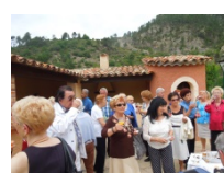
Utelle en 2015