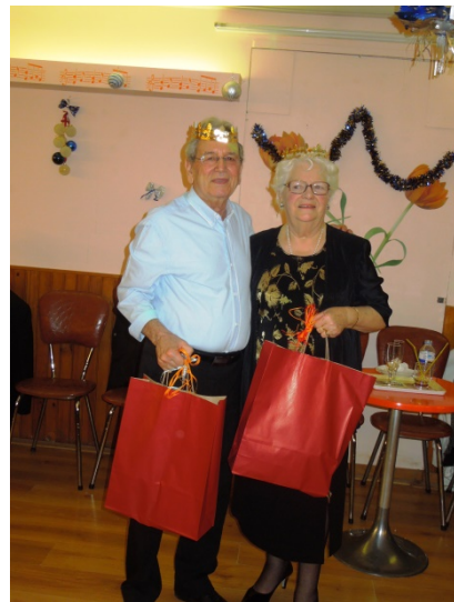
TOUS EN NOIR ET BLANC