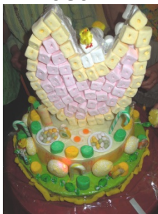
Gâteau jaune et vert en 2015