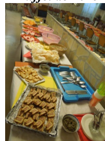
Fête des voisins