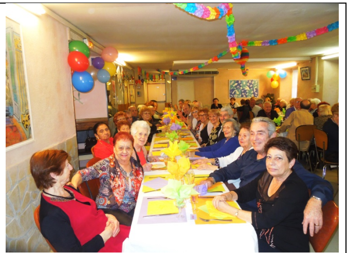
L'équipe des crêpes pour la Chandeleur et le repas de mardi – gras tout en couleurs et une chaude ambiance