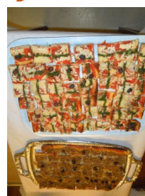
Buffet de 2015