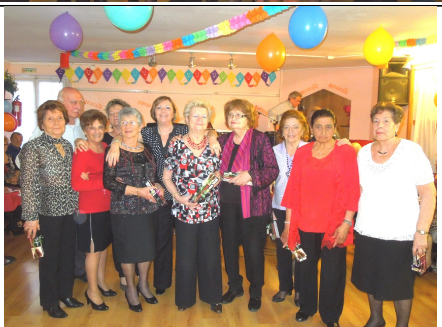
Les natifs de Janvier