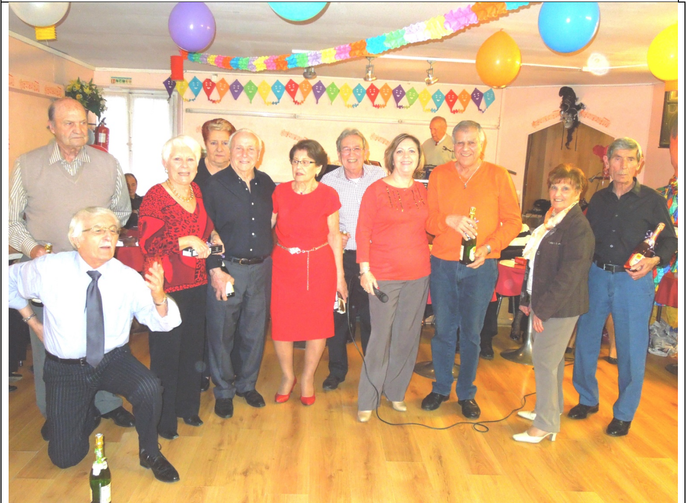
Les natifs de février et les amoureux de la St-Valentin