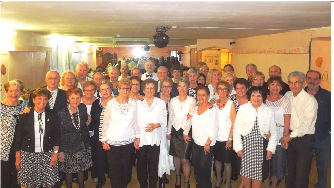
Belle journée au Ligure