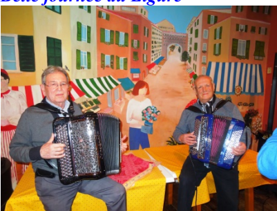
après un excellent repas on danse bien sûr !