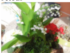
N'OUBLIEZ PAS LE MUGUET